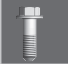
Dimensions in mm