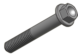
Dimensions in mm